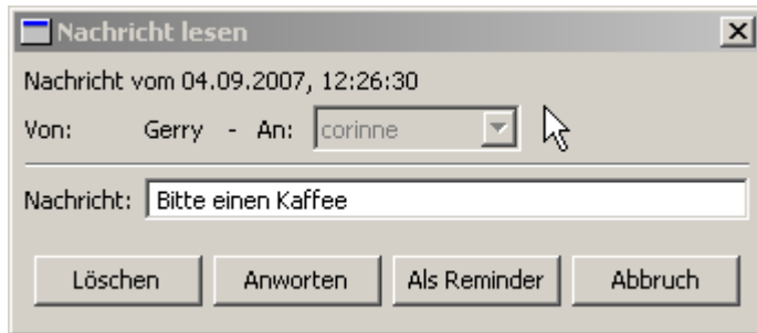
Abbildung 2: Nachricht lesen